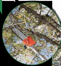
Cierra 10" 10" saw