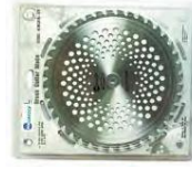
DIS40T cuchilla 40 dientes 40 tooth blade