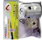
04083302 Cabezal nylon manual metálico manual nylon head