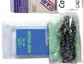
1504001 Cadena para motosierra Saw chain CAD37 17" Cadena 18"