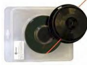
04083301 Cabezal de nylon semiautomático nylon head