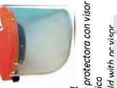
1504002 Pantalla protectora con visor de plástico de plástico face shield with ac visor